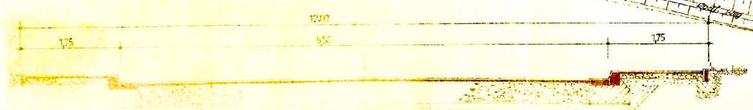
STRASSENQUERPROFIL „A“ MASST. 1 : 50