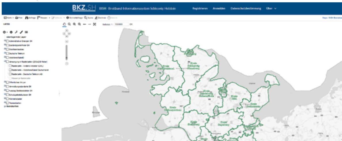
Abbildung 5: Das Breitband-Informationssystem Schleswig-Holstein (BISH, 2018).

Mittlerweile gibt es auch hier verschiedene Fachanwendungen im Internet, wie das Breitband-Informationssystem Schleswig-Holstein als zentrale Geodatenplattform zur Breitbanderschließung. Ziel ist es hier alle relevanten Breitband-Informationen in einem System bereit zu stellen, welche zuvor nur über mehrere Portale abrufbar waren.