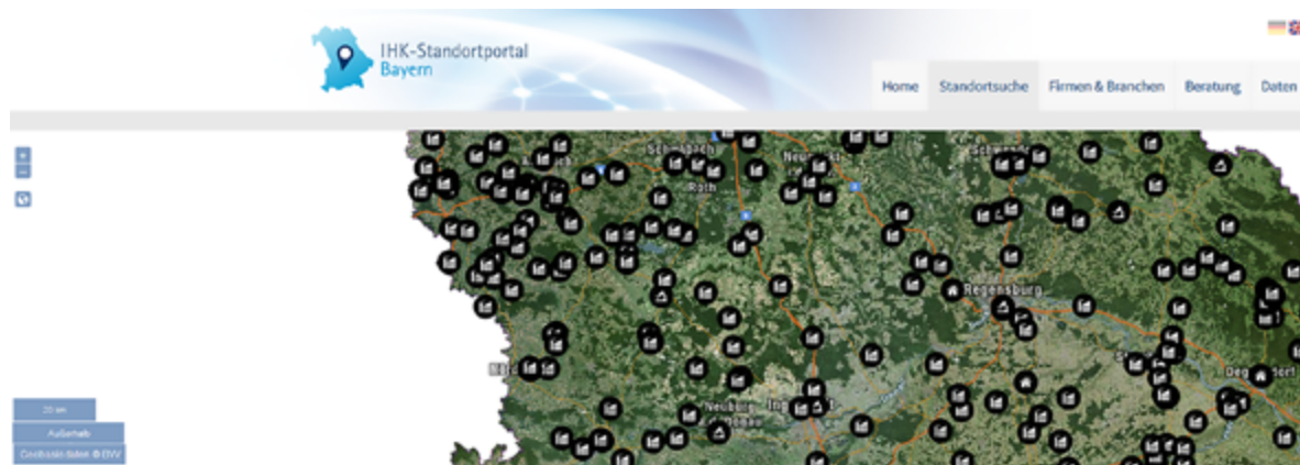
Abbildung 2: Internetauftritt des Standortportals des Bayerischen Industrie- und Handelskammertages (Bayern.de, 2020).