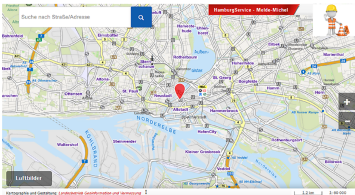
Abbildung 1: Der Melde-Michel der Freien und Hansestadt Hamburg (Hamburg.de, 2020).

Hier ist es mittels die Möglichkeit gegeben, Schäden an der öffentlichen Infrastruktur im Siedlungsgebiet einfach und kartenbasiert zu verorten und zu melden. Dies kann sowohl mit dem Smartphone als auch mit dem Computer erfolgen. Beispiele hierfür sind der „Melde-Michel“ der Freien und Hansestadt Hamburg (Abbildung 1, Hamburg.de, 2020) oder der „Maerker“ des Landes Brandenburg (Brandenburg.de, 2020). Die eingehenden Meldungen werden gespeichert und an die zuständigen Stellen in der Verwaltung oder an Betriebe weitergeleitet.